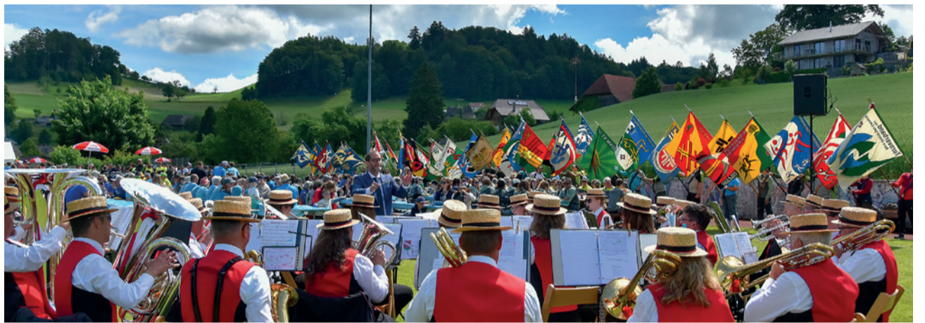
Die Musikgesellschaft Ursenbach sorgte auf dem Festplatz für Unterhaltung.