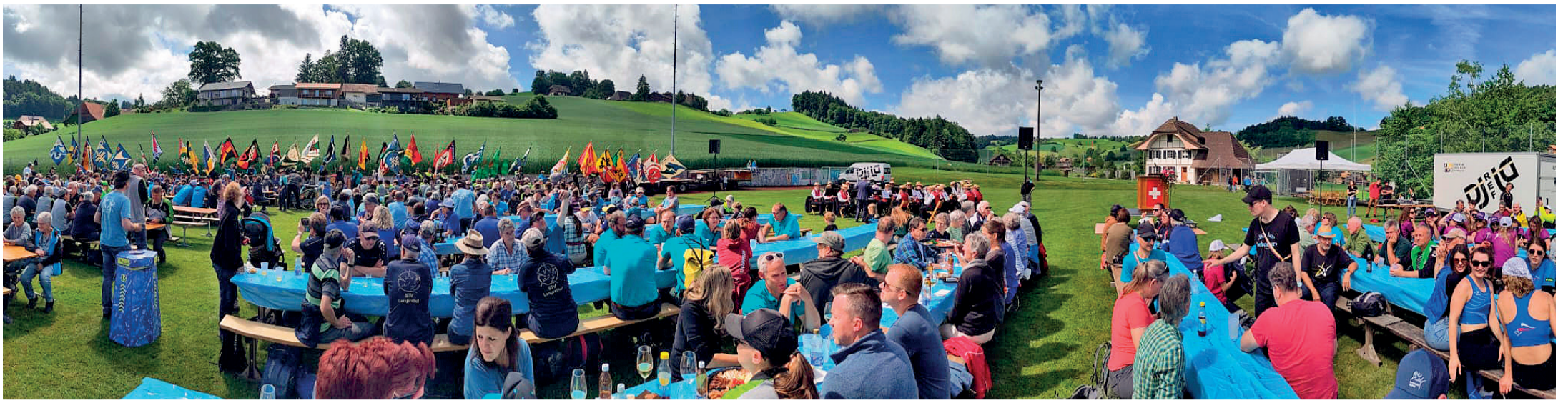
Der Sportplatz in Ursenbach eignete sich optimal für die feierliche Turnfahrt-Feldpredigt.