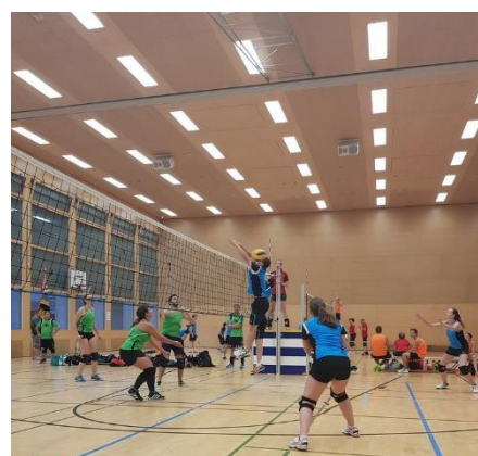
Abbildung 15: Höchste Konzentration auf dem Volleyballfeld