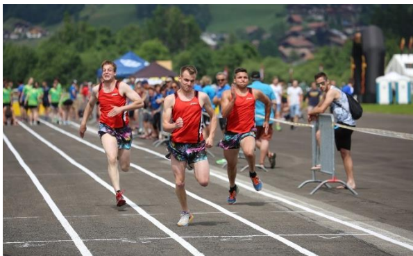
Abbildungen 1+2: Spionage der Konkurrenz