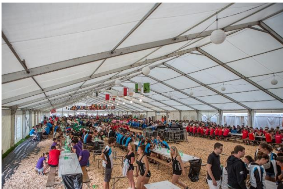
Abbildung 8: Der Hunger gestillt, die Getränke bestellt

Weitere Fotos und Videos können in der Galerie des TV Ursenbach ( http://www.tvursenbach.ch ) angeschaut werden.