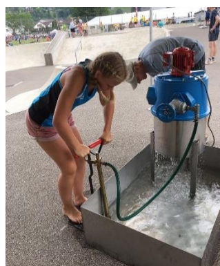
Abbildung 12: ...pumpten...