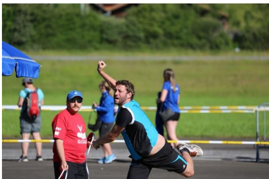
Abbildungen 4+5: Die Kugel soll möglichst weit "gemüpft" werden