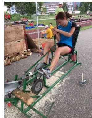
Abbildung 13: ...und traten kräftig in die Pedale um Elektrizität zu erzeugen oder Holz zu zersägen...