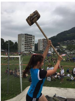
Abbildung 11: Sie hämmerten...