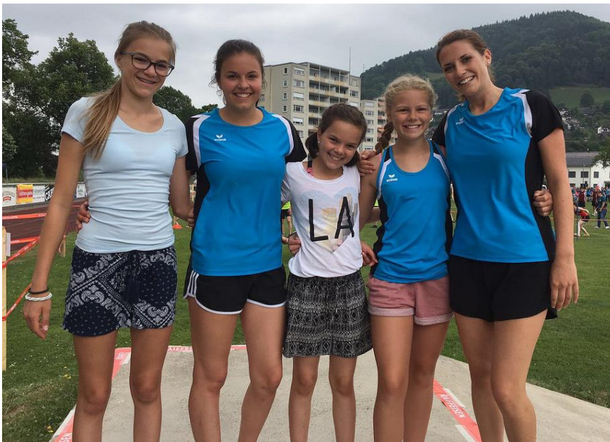
Abbildung 10: Energie-Parcours-Team des TV Ursenbach