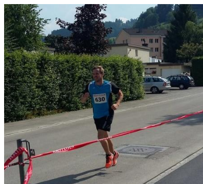
Abbildung 17: Das Motto der LMM-Gruppe: "Möglichst hoch, weit und schnell"