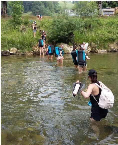
Abbildung 16: Wer das Wasser nicht scheute, konnte sich mehrere 100m Fussmarsch ersparen