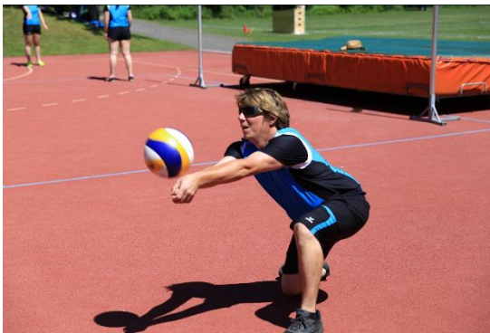
Abbildung 6: Manschette mit vollem Körpereinsatz