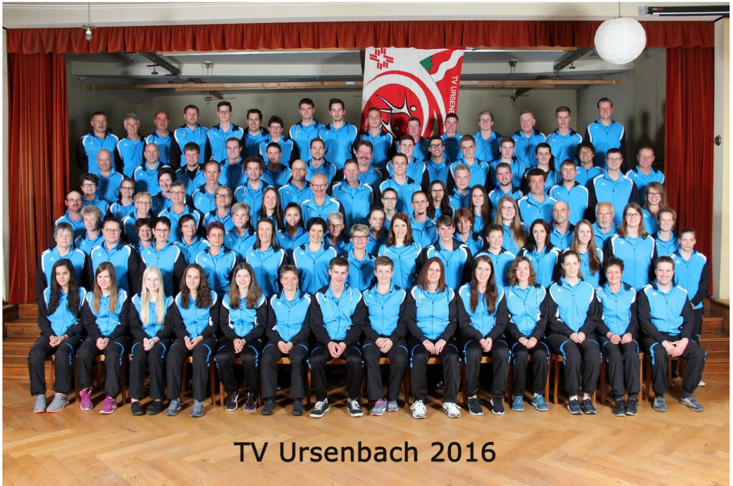
TV Ursenbach 2016