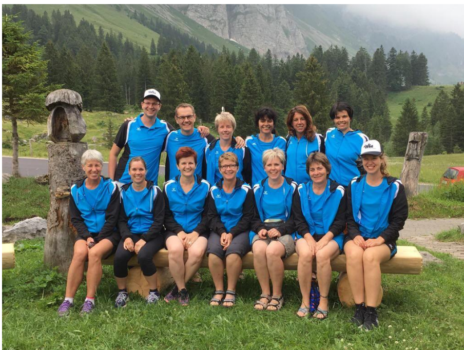
Abbildung 14: «Konffoto» der Dienstagsturnerinnen und -turner auf der Schwägalp