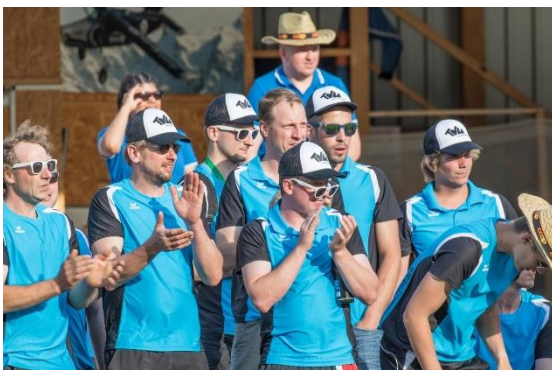
Abbildung 7: Applaus dem TV Koppigen zu seiner Jubiläums-Darbietung mit über 100 Turnerinnen und Turner